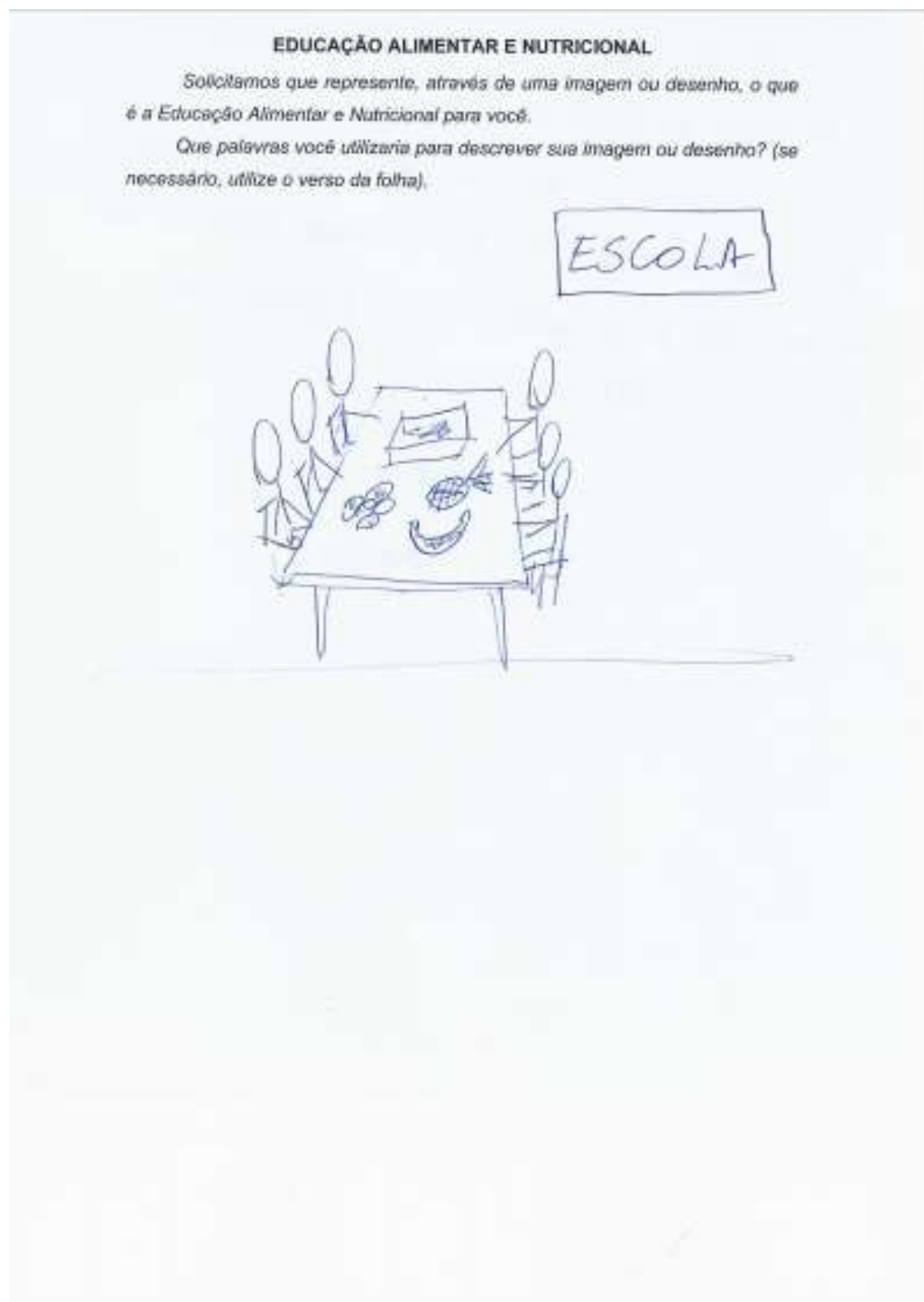
Figura 1 Imagens produzidas pelos estudantes