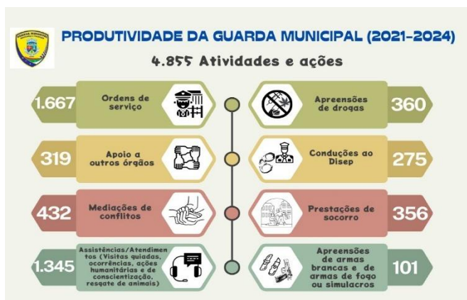
Figura 1 - Produtividade da Guarda Municipal de Vitória da Conquista (2021-2024)

Fonte: Elaborado pelas autoras, baseado no Relatório de balanço da produtividade da Guarda Municipal, 2021 a 2024.