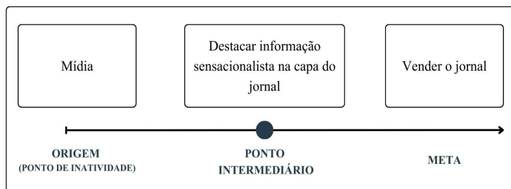
FIGURA 3. Esquema imagético da trajetória