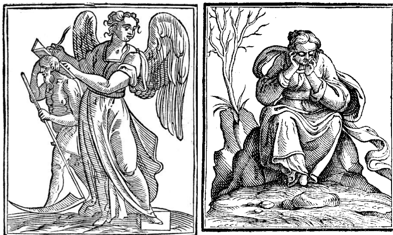
Fig. 2. Cesare Ripa, “La historia” 20 , Iconologia , 1630. Fig. 3. Cesare Ripa, “Malinconia”, Iconologia , 1630.

Suspenso entre o céu e a terra, o anjo melancólico é uma imagem da espera, da suspensão, da paciência. Não por um acaso, em nota autobiográfica de 1933, significativamente intitulada “Agesilaus Santander” (um anagrama de “ Angelus Satanas ”), Benjamin dizia: