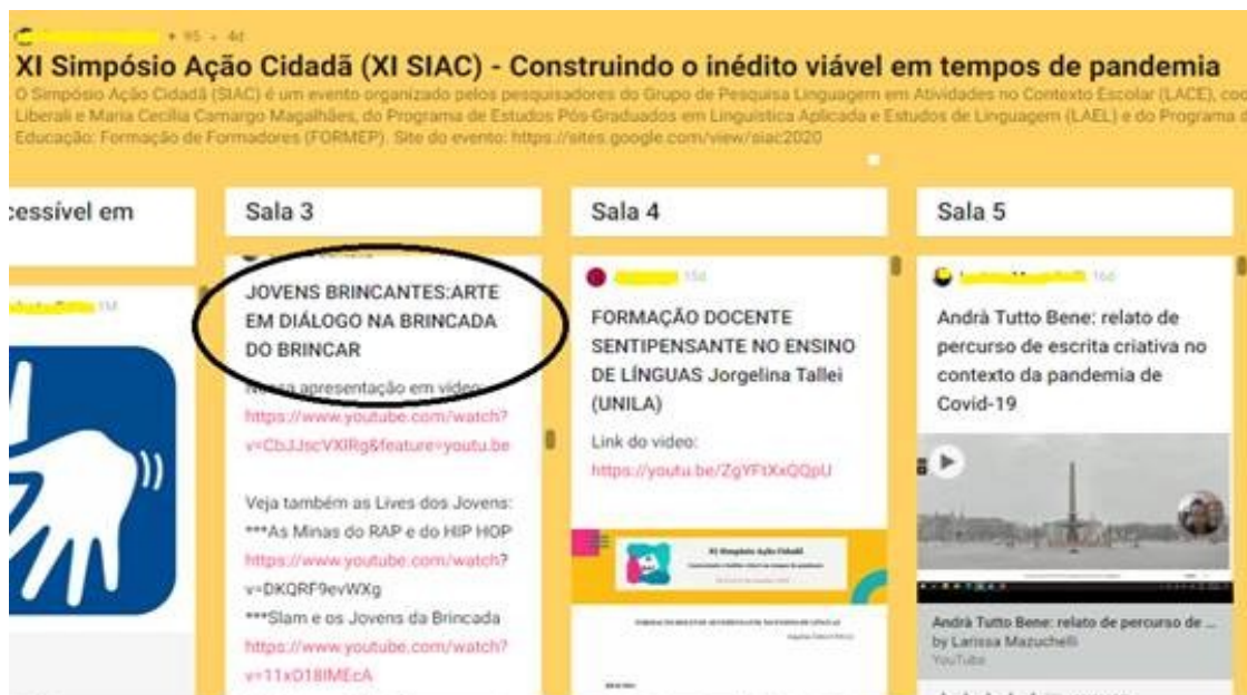
Figura 2: Print da tela.

Entre os dias 05 e 06/11/2020 aconteceu a discussão da apresentação no aplicativo Padlet, os jovens responderam às perguntas, interagindo com outros participantes do Simpósio. As perguntas “Caramba!! Como vocês são arretados!! adorei esse papo jovem...uma pegada bem casual e leve mais com certo aprofundamento nos debates” e “Muito gostoso ver o modo como vcs assumem responsabilidade sobre a realidade. Como vcs imaginam o futuro da Brincada Jovem?” suscitou diversas interações.