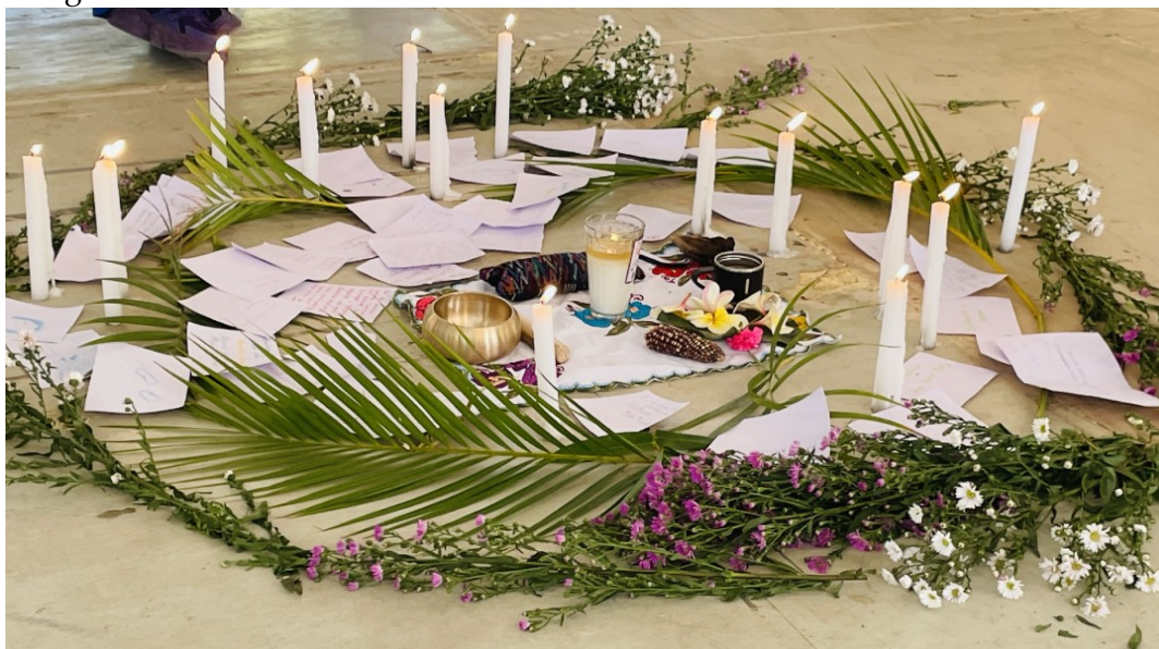
Fotografía 1- Ritual de inicio del cuidado