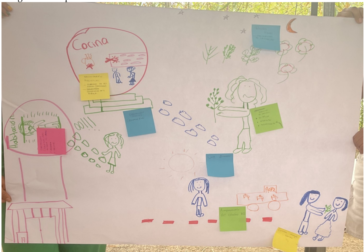
Fotografía 4- Mapeo del cuidado