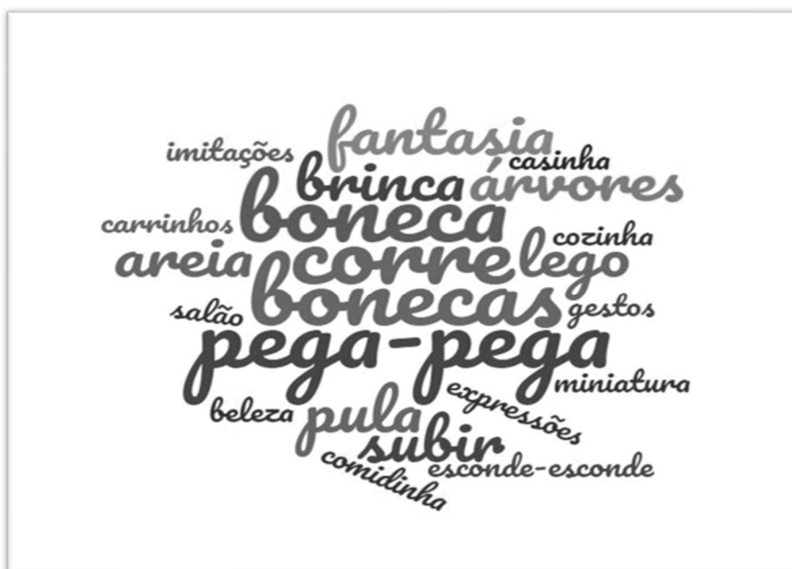
QUADRO 2 – NUVEM DE PALAVRAS A PARTIR DOS PARECERES DESCRITIVOS – EIXO: PREFERÊNCIAS DAS MENINAS – GRUPO B

FONTE: Elaborado pelas autoras a partir dos pareceres descritivos. 2019.