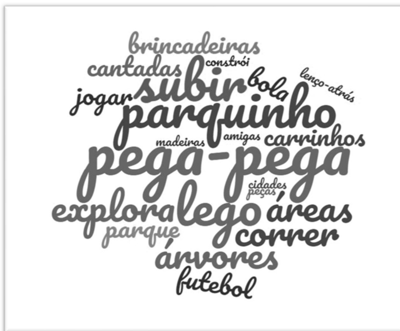
QUADRO 1 – NUVEM DE PALAVRAS A PARTIR DOS PARECERES DESCRITIVOS – EIXO: PREFERÊNCIAS DOS MENINOS – GRUPO B