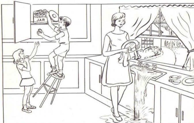
Figura 3: Imagem da tarefa prancha do roubo dos biscoitos.