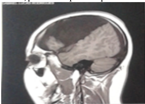
Figura 1. Ressonância magnética: corte sagital, evidenciando o comprometimento do lobo frontal, parietal e temporal à esquerda

De acordo com Marafon (2019), o participante foi diagnosticado com esquizecefalia de lábios abertos, com a fenda preenchida por líquido cefalorraquidiano, ainda quando era recém-nascido. Os laudos médicos oriundos, principalmente, de exames de ressonância magnética e eletroencefalograma (EEG) digital com mapeamento cerebral, mostram que o participante possui uma malformação no hemisfério esquerdo que afeta os lobos frontal, parietal e temporal esquerdo (ver Figura 1).