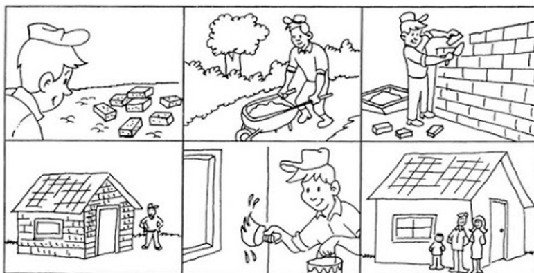
Figura 4. Imagem da tarefa História em seqüência.

c) História em seqüência . A tarefa requeria que o participante observasse a seqüência de imagens (Figura 4) e relatasse a história (por escrito), com o máximo de detalhes. Para cumprir a tarefa, o participante teria que reconhecer personagens (construtor, pai, mãe, criança), objetos (tijolo, pincel, tinta, cimento, carrinho de mão por exemplo), espaços (terreno, casa), eventos (o construtor iniciou a construção de uma casa, providenciou o material necessário, levantou as paredes da casa e pintou a casa; quando a casa ficou pronta uma família veio morar nela) e estrutura narrativa (situação - personagens e cenário; complicação - seqüência de eventos; e desfecho - resolução).