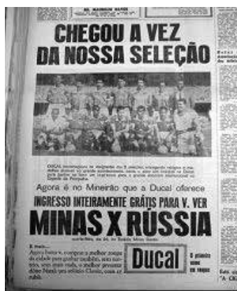
Figura 1 7

O estádio foi inaugurado no dia 5 de setembro de 1965 com a vitória do Atlético Mineiro sobre o argentino River Plate, com um público presente de aproximadamente 100.000 pessoas (cf. JORNAL EM, 07/09/1965). A primeira ocorrência do apelido “Mineirão” foi encontrada em 21 de novembro de 1965 e aparece documentada na figura 1. A figura 2 anuncia a nomeação oficial “Estádio Governador Magalhães Pinto” ocorrida em 11 de janeiro de 1966, por determinação do governador do Estado; mas essa não “vingou”.