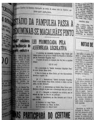
Figura 2 8