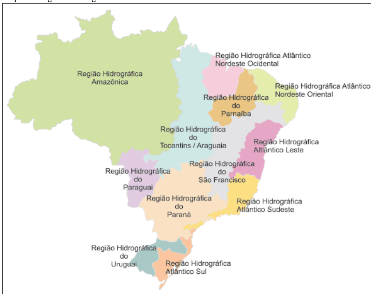
Mapa 1- Regiões hidrográficas brasileiras

Segundo a ANA (2002, p. 43), “para fins de gestão de recursos hídricos e dentro do [contexto] da Lei das Águas, divide-se o Brasil em regiões hidrográficas. Uma região hidrográfica é uma bacia ou conjunto de bacias hidrográficas contíguas onde o rio principal deságua no mar ou em território estrangeiro.” Atualmente, no Brasil são consideradas 12 regiões hidrográficas: Amazônica, Tocantins-Araguaia, Atlântico Nordeste Ocidental, Parnaíba, Atlântico Nordeste Oriental, São Francisco, Atlântico Leste, Paraguai, Paraná, Sudeste, Uruguai e Atlântico Sul (Figura 1). Neste trabalho, entretanto, concentra-se a investigação sobre a região Atlântico Leste.