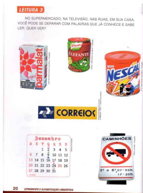
ILUSTRAÇÃO 1 – Reflexão sobre o sistema alfabético - 2009