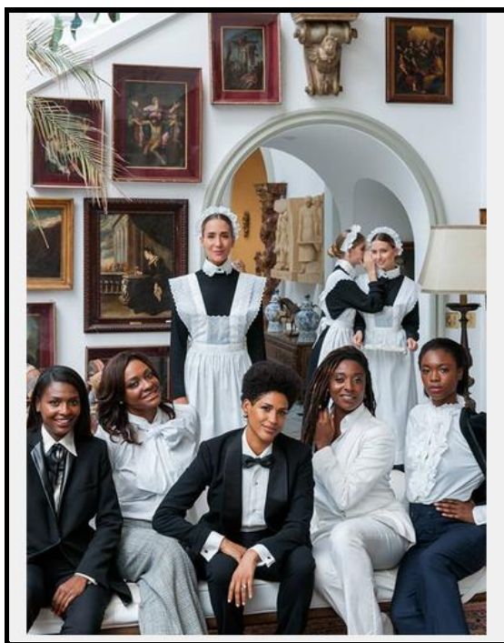
FIGURA 4 57

Imaginar a identidade negra como valorizada, positiva, privilegiada. Um imaginário isento de preconceito. Uma imagem empoderada dos negros. Desvelar, revelar, promover a difusão das vozes das mulheres negras, em diferentes linguagens, em todos os espaços e níveis da vida nacional.