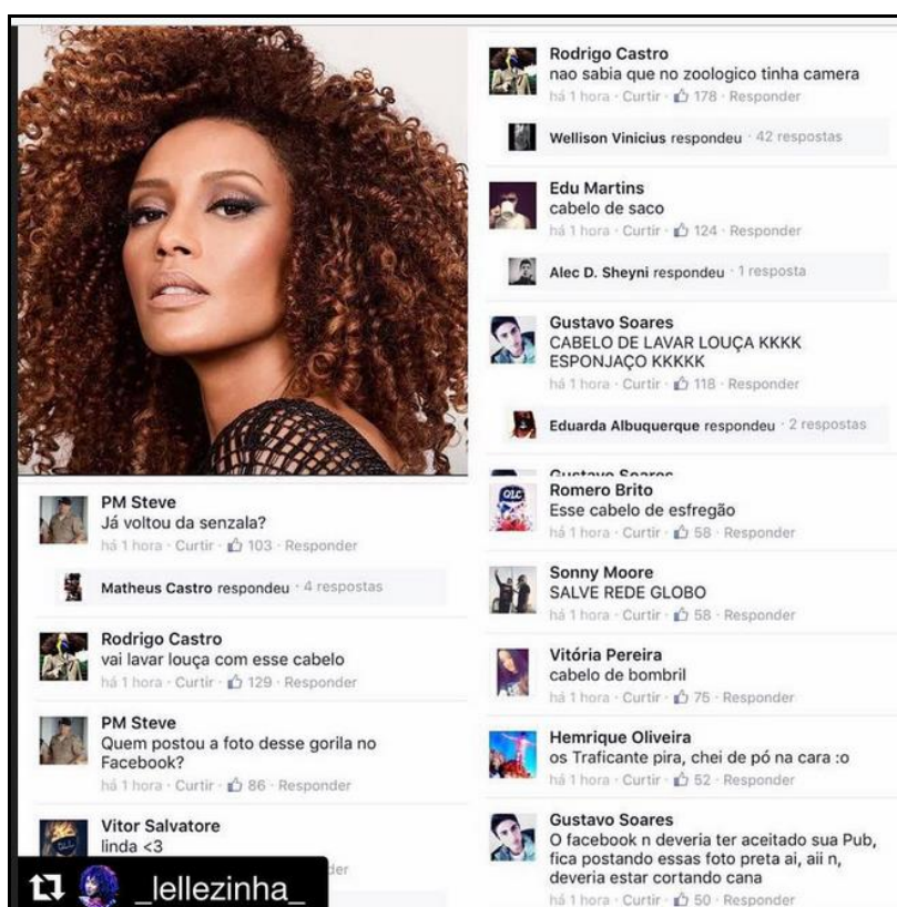
30