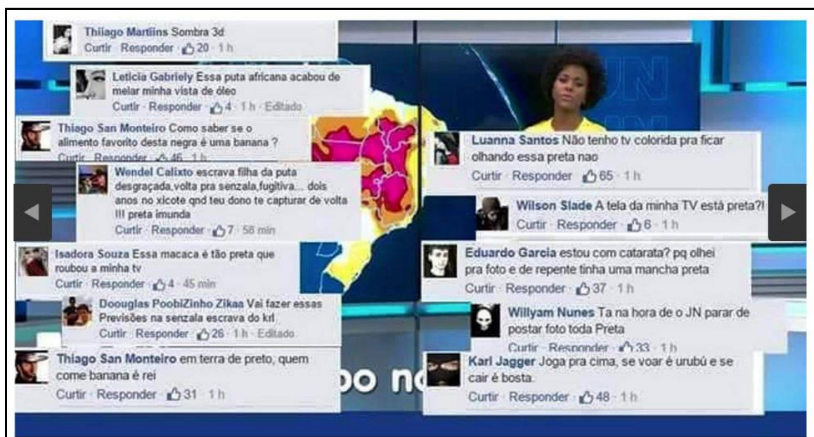
Agressões racistas na página do "Jornal Nacional" 32