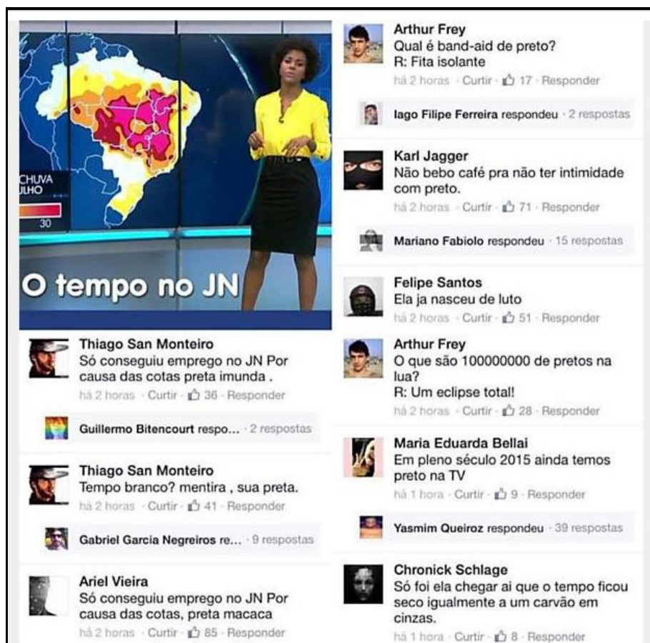
Agressões racistas na página do "Jornal Nacional" 33

Agressões racistas dirigidas a mulheres negras, que desafiam o padrão de beleza que é ter a pele branca, os cabelos louros e lisos e os olhos claros. O fenótipo negro, com cabelos cacheados ou black power e olhos escuros, afronta ao padrão estético hegemônico, e por este motivo, causam comportamentos e discursos racistas. As agressões destacam a imagem do negro ainda presente no imaginário da sociedade brasileira: escravo, inferior, incapaz; não adequado ao lugar de destaque, e sendo mulher, considerada objeto sexual.