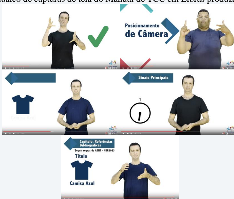
Figura 2. Mosaico de capturas de tela do Manual de TCC em Libras produzido pela UFPE.