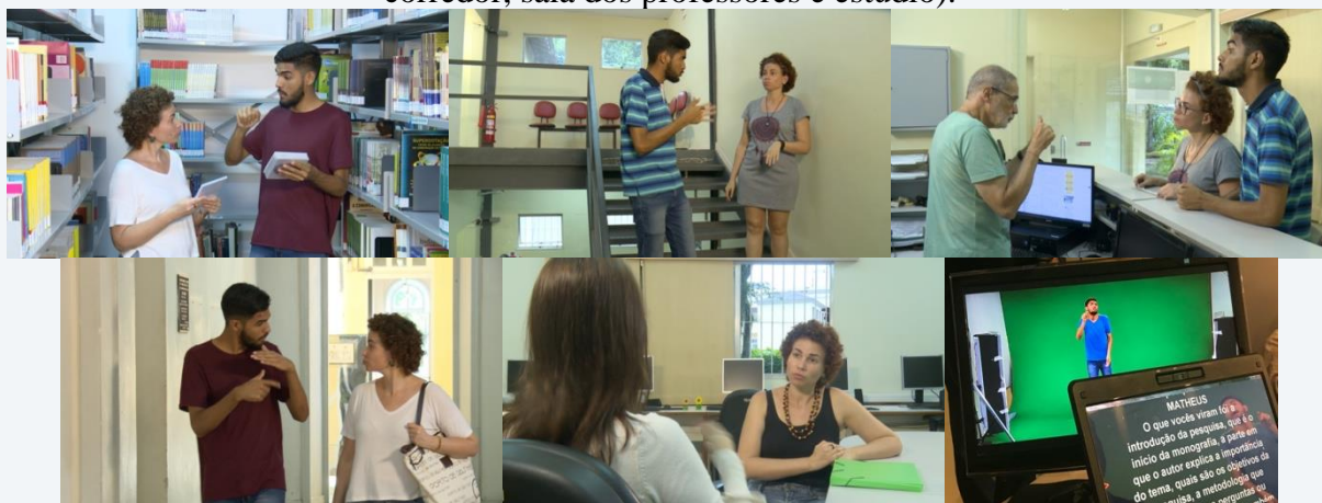
Figura 5. Filmagens em diversos lugares do INES (cenas na biblioteca, escada, secretaria, corredor, sala dos professores e estúdio).

As locações para filmagens incluíram diversos ambientes do DESU e do prédio principal do INES, de modo a percorrer todos os espaços por onde circulam os alunos graduandos e onde encontram serviços necessários à feitura da monografia. Ressaltamos que era enviado, previamente, um ofício com o pedido e uma autorização do responsável para cada ambiente a ser utilizado.