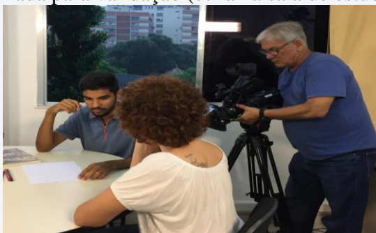
Figura 4. Tomada para validação (cena na sala de estudos do DESU).

Após os ensaios e tomadas feitas como teste, para cada enquadramento é feita uma tomada “pra valer”. Nela, é filmada a cena sem a interferência dos pesquisadores visando seu uso como material final. As filmagens são feitas em diferentes ângulos (tomadas) para que seja possível a aplicação de cortes, promovendo a sensação de existência de múltiplas câmeras (multicâmera), enfatizando detalhes do ambiente (transições) e a expressão dos personagens (primeiro plano e plano detalhe), assim como objetos que precisem ser destacados ( close ). Um exemplo de ênfase ( close ) é aquele que vemos na Figura 4 onde o profissional que opera a câmera destaca a glosa que está sendo feita pelo aluno em uma das cenas da novela em que o personagem está explicando a técnica para a outra personagem.