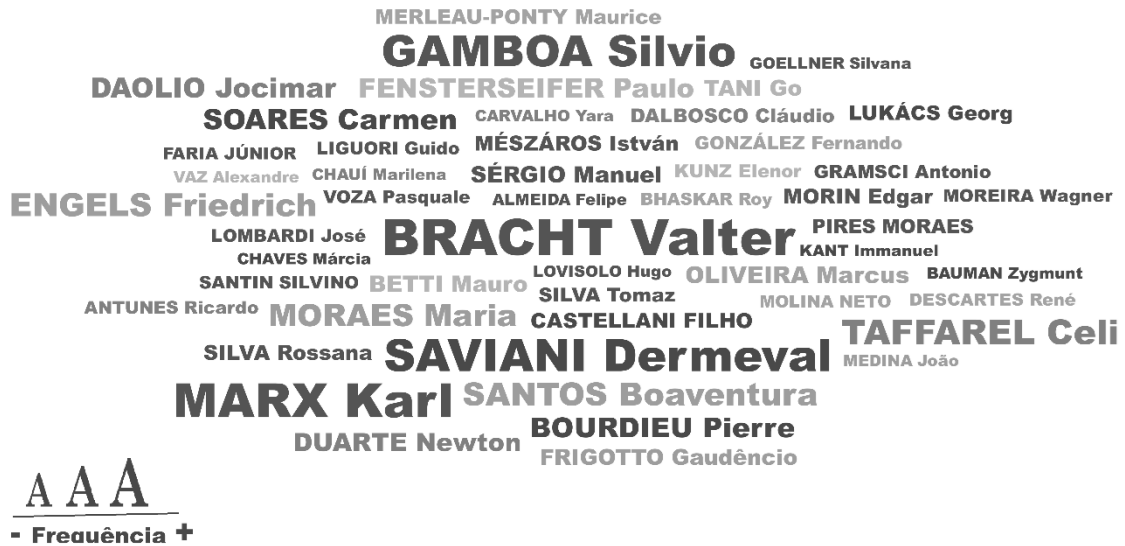
Figura 1 – nuvem dos principais autores referenciados

mais referenciados? É possível traçar um caminho do debate epistemológico da Educação Física brasileira a partir do número de referências feitas aos mais diversos autores? Para tal intento, elaboramos a figura 1.