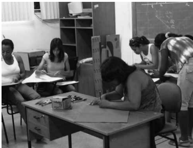
Figura 3 – Construção de materiais didáticos pelos professores colaboradores.