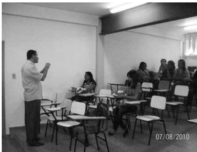
Figura 2 – Registros dos encontros presenciais.

Como descrito na dinâmica de desenvolvimento do trabalho, uma das fases dos encontros era refletir sobre a validade das atividades aplicadas e as possíveis dificuldades na aplicação das mesmas e avaliar o desempenho dos alunos em relação a estas. Neste momento os professores compartilhavam as experiências vivenciadas durante as suas aulas, tiravam dúvidas com os professores formadores e com os próprios colegas. A figura abaixo ilustra um dos professores convidados trabalhando com um grupo de professores.