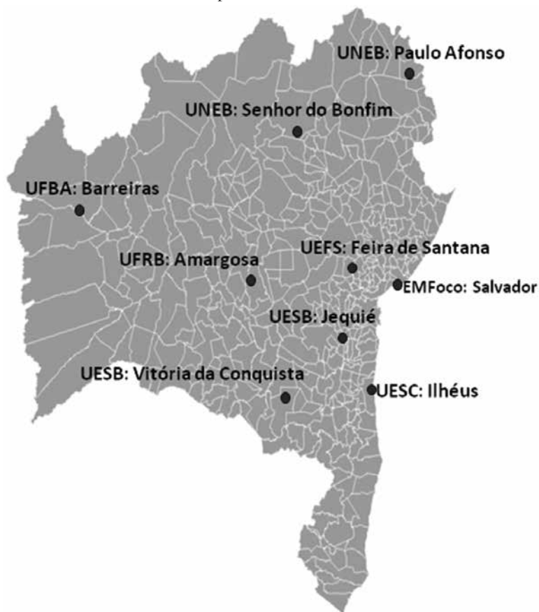
Figura 1 – Mapa da Localização dos Núcleos da SBEM – BA, parceiros do PEA.