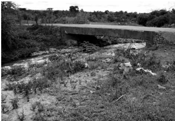
Figura 2 – Rio Verruga que passa no Assentamento Amaralina