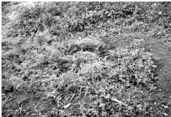
Figura 3 – Horta da Escola Municipal Baixa da Fartura

Fonte: Foto da autora, em pesquisa de campo, novembro de 2009.