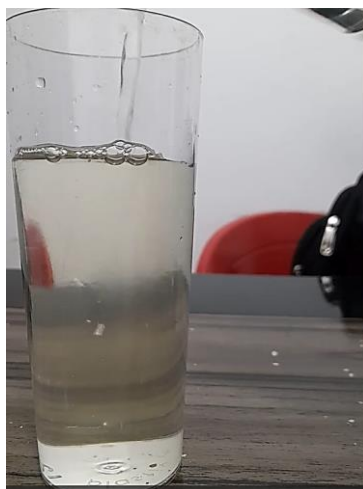
Figura 3- Mistura de Hipoclorito de Sódio com o xarope, alterando a cor