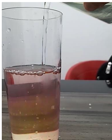
Figura 2- Adição de Hipoclorito de Sódio no xarope diluído em água

Ao misturar a água sanitária no copo que continha o xarope diluído em água, ocorre uma mudança na coloração de rosa para amarelo, conforme a figura 2.