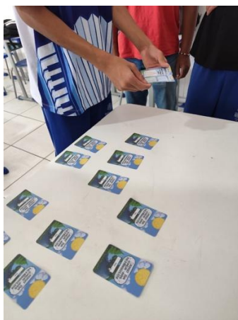
Figura 3: Vivência do Jogo da Memória dos Triângulos

A segunda etapa, conforme Figura 3, envolveu a aplicação do Jogo da Memória dos Triângulos, concebido para consolidar as aprendizagens construídas anteriormente. O jogo, ao demandar atenção, memória e articulação entre representações, possibilitou que os alunos revisitassem conceitos como classificação, ângulos internos, perímetro e condição de existência dos triângulos. Nessa etapa, novamente se evidenciaram dificuldades relacionadas aos cálculos envolvendo ângulos internos, o que reforça a necessidade de intervenções pedagógicas contínuas e planejadas, articuladas com as competências previstas na BNCC (Brasil, 2018) e com o uso de abordagens investigativas (Lorenzato (2012; Silva, 2026). Contudo, o entusiasmo dos estudantes, mesmo diante das dificuldades, apresenta indícios da potencialidade dos jogos enquanto recursos capazes de mobilizar o interesse, promover autonomia e favorecer a construção de significados matemáticos (Muniz, 2016).