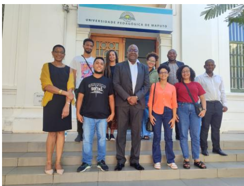
Imagem 2: Foto em Frente da Reitoria da Universidade Pedagógica de Maputo com o reitor e os diretores responsáveis pela cooperação.