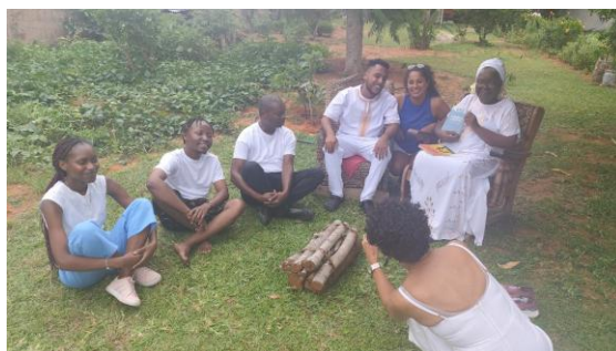
Imagem 1: Intercambistas na casa da Paulina em uma roda de conversa.

Outro momento marcante foi a visita à residência da escritora Paulina Chiziane, vencedora do Prêmio Camões em 2021 e do Prémio José Craveirinha em 2003. Durante o encontro, houve uma valiosa troca de reflexões e conhecimentos sobre literatura, ancestralidade e identidade, fortalecendo a compreensão das produções literárias africanas.