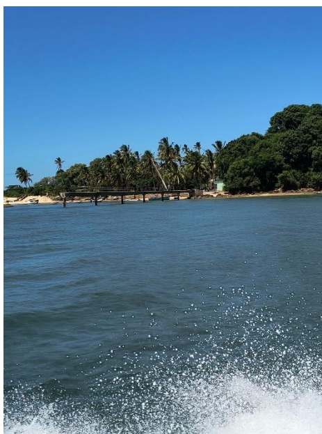
Imagem 8: Porto e entrada da Ilha

Outro evento de destaque dentro das atividades de campo realizadas foi a visita à Ilha da Inhaca (imagem 8), que, de acordo com Pereira e Nascimento (2006), trata-se de uma pequena formação insular localizada no Oceano Índico, especificamente na Baía de Maputo, em Moçambique. Situada a aproximadamente 32 quilômetros de Maputo, capital do país, a ilha possui uma área total de cerca de 42 km 2 , sendo a maior das duas que compõem o Arquipélago da Inhaca, juntamente com a Ilha dos Portugueses. O nome “Inhaca” tem origem na adaptação do termo “Nhaca”, que faz referência a um antigo chefe tsonga que viveu na região de Maputo por volta do século XVI, cuja dinastia deu nome ao local.