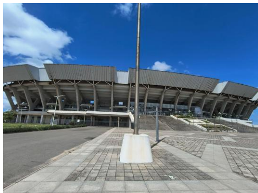
Imagem 5: Estádio Nacional do Zimpeto