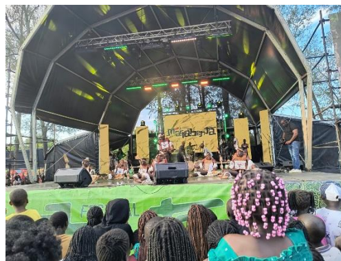
Imagem 7: Palco do evento e pessoas assistindo o show.

Saindo da cidade de Maputo, também pudemos ir a Marracuene, participar do festival chamado Gwaza Muthini (imagem 7). Este festival não é somente um espaço para lazer e diversão, com suas diversas atrações musicais locais e ritmos tradicionais, mas também um evento para lembrar e não deixar ser esquecida uma das batalhas mais intensas e sangrentas da história do país.