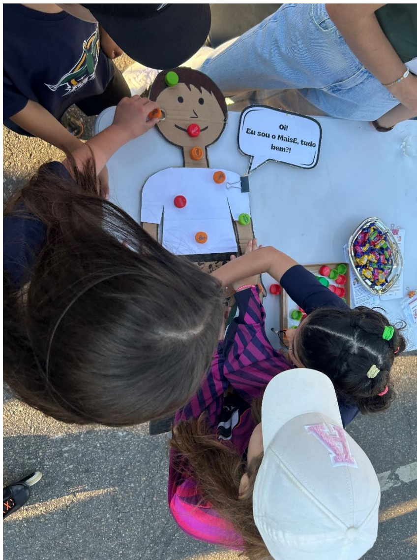
Figura 3 - Jogo de tabuleiro sendo usado pelos jogadores