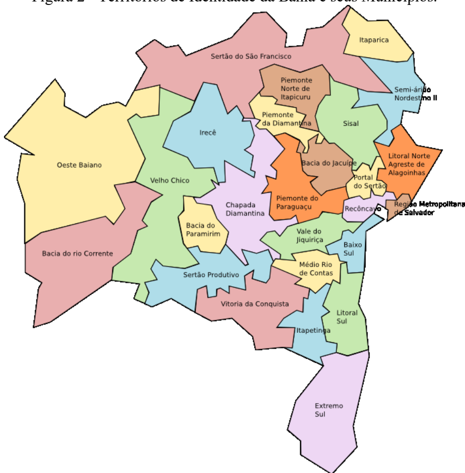
Figura 2 - Territórios de Identidade da Bahia e seus Municípios.