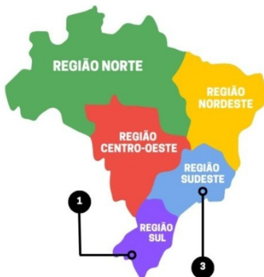
Figura 1 – Quantidade de trabalhos publicados por região brasileira