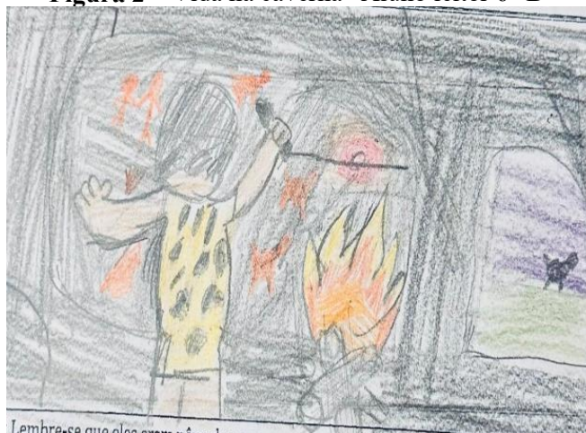
Figura 2 – Vida na caverna “Aluno leitor 6º B”

As outras duas imagens representam alunos, de ambas as salas, com uma compreensão leitora mais avançada, o que os permitiu realizar toda a atividade escrita com muita assertividade. Suas representações pictóricas trazem elementos distintos do que seria a vida na pré-história.