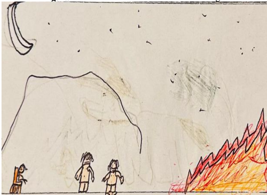
Figura 1 – Aluna não leitora 6º A. “A era do fogo”

sobrevivência humana em épocas tão adversas. O sentido de proteção desse recurso natural também fica evidente, inclusive com um dos personagens sentado em uma cadeira.