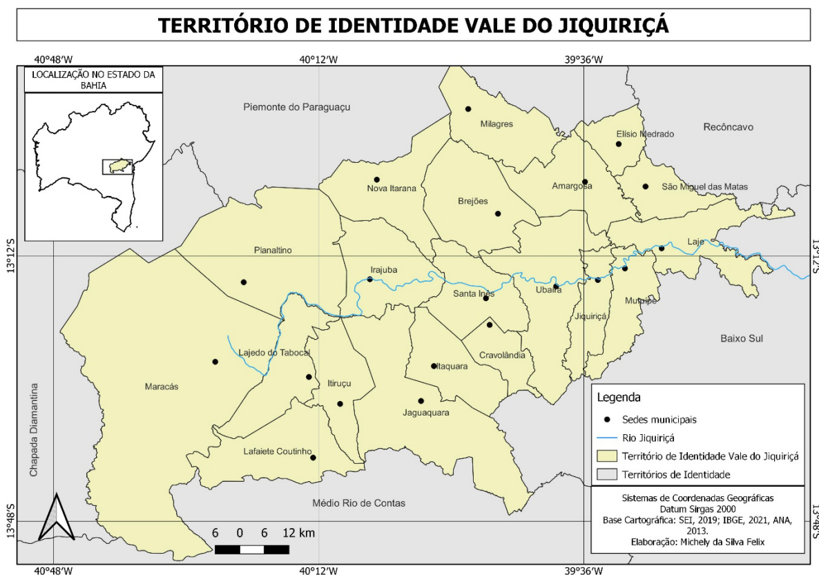
Figura 1: Território de Identidade Vale do Jiquiriçá.

Elaboração: Michely da Silva Felix (2025).